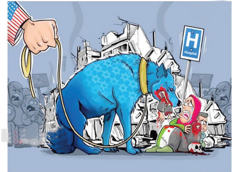
استمرار جنایات رژیم صهیونیستی با چراغ سبز آمریکایی‌ها