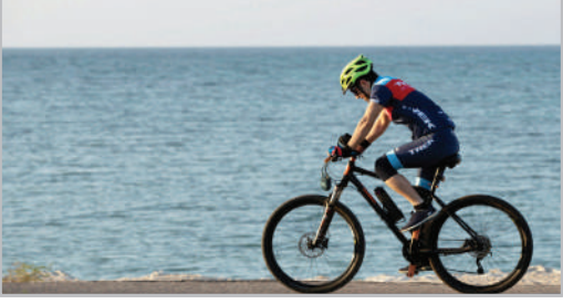
هوای پاک جزیره کیش