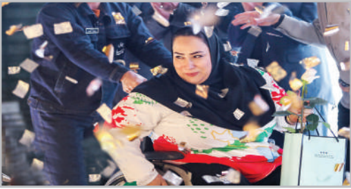
تقدیر از بانوان قهرمان پارالمپیک مسابقات آسیایی