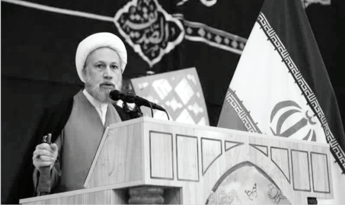
ایدان، دوکام افزود: ملت ایران ملتی

غزه که ۲ ماه است از این حادثه می‌گذرد اشاره کرد و افزود: در طول این مدت چندین هزار تن بمب بر سر فلسطینیان ریخته شد.