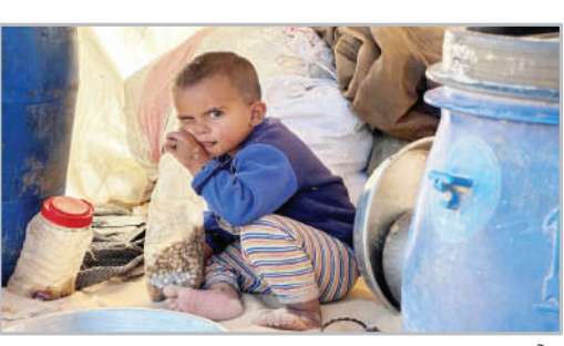
آوارگان جنگ در منطقه رفح - جنوب نوار غزه