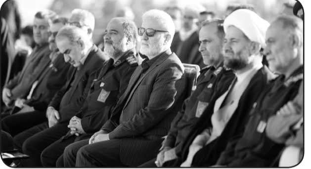
رئیس شورای اسلامی شهر شیراز تصریح کرد: