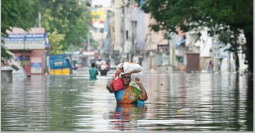
سیل - چنای هند