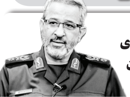
جانشین فرمانده کل سپاه در قرارگاه امام علی(ع):