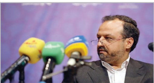
حضور وزیر اقتصاد و دارایی در دانشگاه فردوسی مشهد