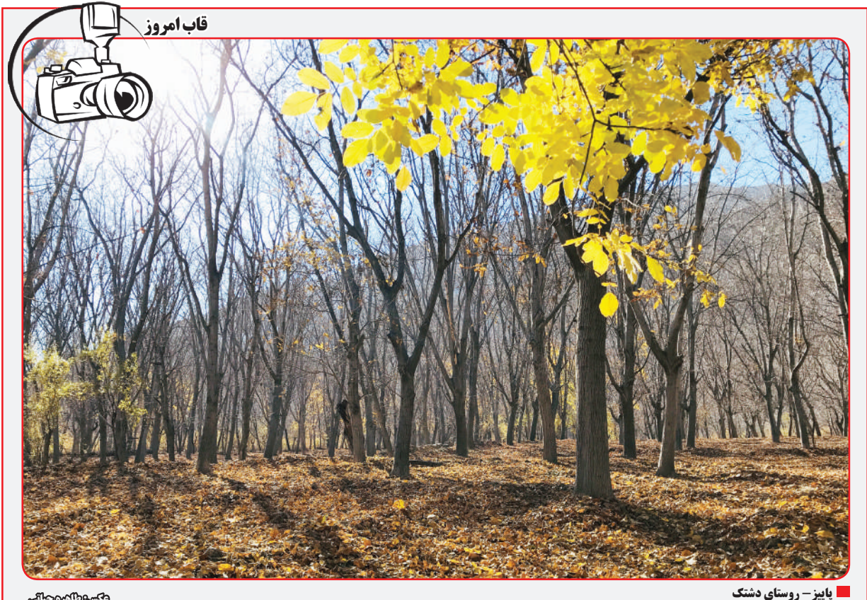
بایز - روستای دشتک

جنمای توسط گوگل و آلفابت که شرکت مادر گوگل است، ایجاد شد و به عنوان پیشرفته‌ترین